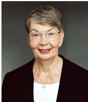
Landesbischöfin Kristina Kühnbaum-Schmidt Landesbischöfin der Evangelisch-Lutherischen Kirche in Norddeutschland und EKD-Schöpfungsbeauftragte